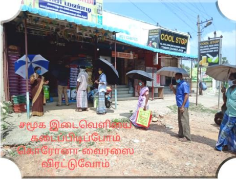
சமூக இடைவெளியை கடைப்பிடிப்போம் கொரானா வைரஸை விரட்டுவோம்