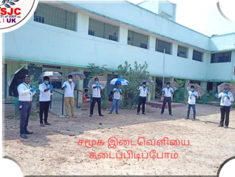
சமூக இடைவெளியை கடைப்பிடிப்போம்