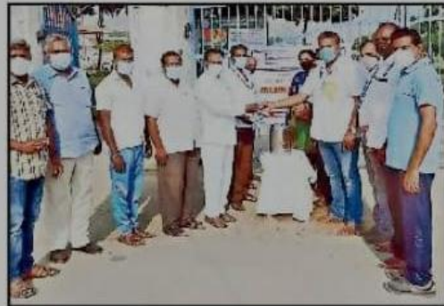
కషాయం పంపిణీ చేస్తున్న నిర్వాహకులు